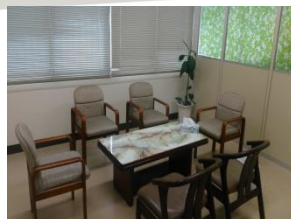
めんせつしつ 面接室