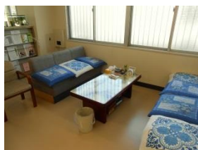
だんわしつ 談話室